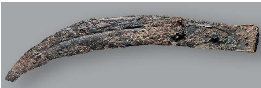
Trinkszene neben der Glashütte in der Schottenau, aus Stainhofer 1566.

(Mölker-)Bastei beim Schottentor, Angiellini-Plan um 1570.