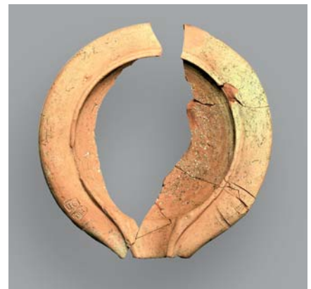
Kurzzeit: FWien 21, 2018

Sica aus der Grabung Wien 3, Kundmangasse 21–27.