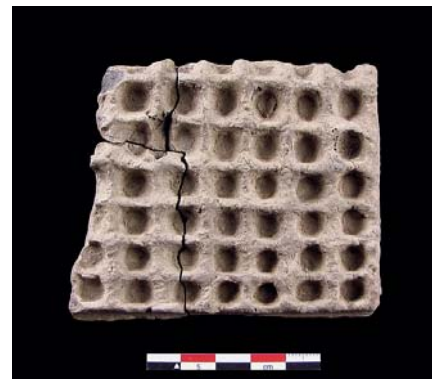
Rollenkopfnadel aus Bronze, Wien 22, Edith-Piaf-Straße 4. M 1:1 (Zeichnung: M. Penz) Hornsteinfunde vom Inzersdorfer Wald (Slg. R. Kunz). (Foto: M. Penz) Römerzeitliches Gesichtsgefäß, Grabung Rennweg 88–90. (Foto: N. Piperakis) Fragment einer keltischen Tüpfelplatte, Grabung Rasumofskygasse. (Foto: N. Piperakis)